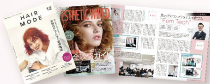
HAIR MODE / NEXT LEADER / ESTHETIC WIRED