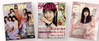
ar / &ROSY / yoga JOURNAL / GLOW / an・an / steady